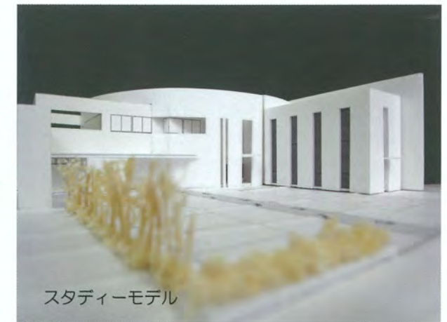
スタディーモデル